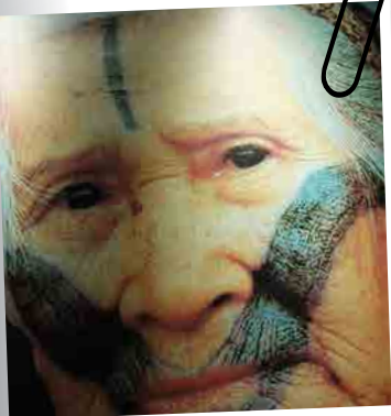
在烏來博物館展出從前原住民紋面習俗的照片