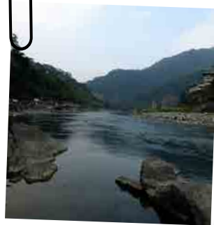
烏來水天一色，此處為天然泉眼的位置

「我留下平安給你們，我將我的平安賜給你們。我所賜的，不像世人所賜的。你們心裡不要憂愁，也不要膽怯。」約14:27