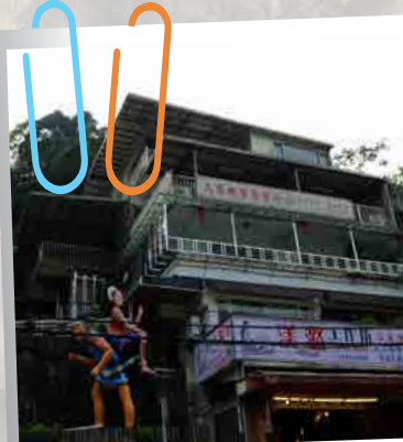
除了幾間大基督教教會外，近年烏來也有開設了不少新的教會