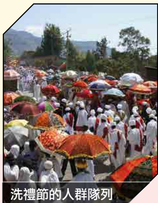
洗禮節的人群隊列

如果你有興趣知道更多有關施達基金會在埃塞俄比亞或其他地區的事工，請到 www.cedarfund.org