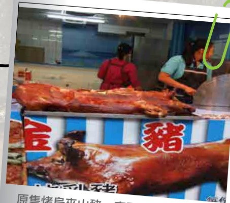
原隻烤烏來山豬，真正皮脆肉嫩