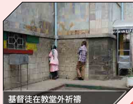
基督徒在教堂外祈禱