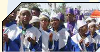
洗禮節隊列中的小孩