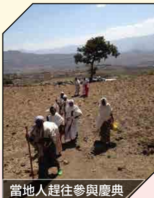
當地人趕往參與慶典