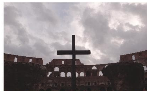
^ 到羅馬必遊的競技場，上層的中間有一個入口，放了一個巨型十字架，像是為結束這裡的血腥運動而設。