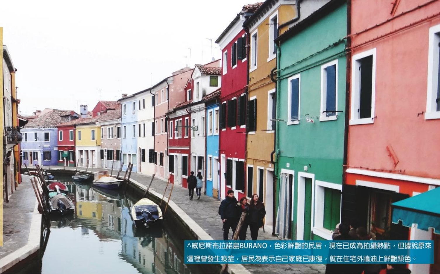
^ 威尼斯布拉諾島BURANO，色彩鮮艷的民居，現在已成為拍攝熱點，但據說原來這裡曾發生疫症，居民為表示自己家庭已康復，就在住宅外牆油上鮮艷顏色。

雖然梵蒂岡就在意大利首都羅馬之中，但從旅客身份來看，這裡還是一個罪惡之城，罪案在旅遊區每天不停發生，故與太太同行時都份外小心。當然這裡已沒有馬丁路德時代的贖罪券、摸聖骨、爬聖梯等欺騙技量，換來的卻是手繩黨、吉普賽小偷、假警察等。每次乘羅馬陳舊的地鐵，遊客總是把背包放在胸前，也不會與身邊的外國人談話，看似危機四伏，想起「只因不法的事增多，許多人的愛心才漸漸冷淡了。」(太24:12)其實當地人大部份信奉天主教，只要大家交出真誠，打開談話的第一步，很多意大利人也友善及樂於幫助遊客的，不過很多時末句也是叫我們要小心小偷。遊走了意大利幾個城市，發現他們治安最好是北部的威尼斯及米蘭，從位處中部的佛羅倫斯及羅馬開始，治安就愈見惡劣，南部景色雖美，卻常有劫案發生。難怪很多旅遊網站也叫大家不要輕信當地人，以免受騙，相信意大利人對此也感到十分無奈。